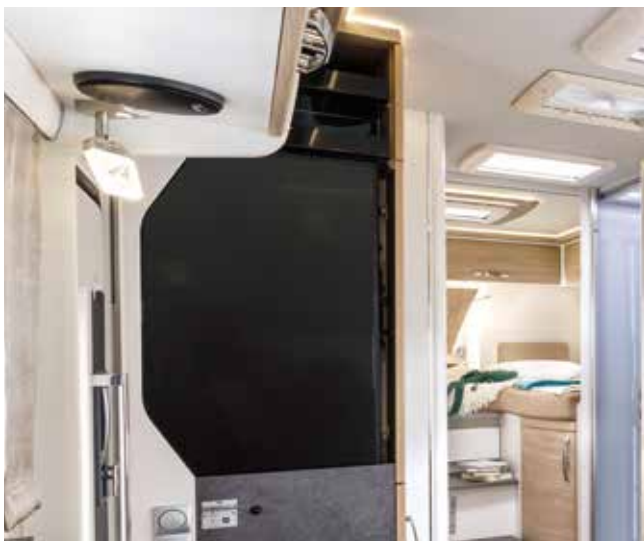
Écran plat 32 pouces (image à titre d'exemple)