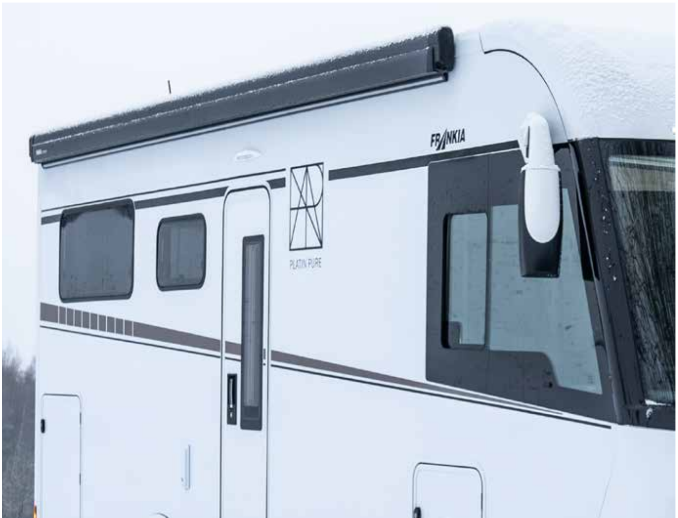
Store avec éclairage LED intégré (exemple de modèle)