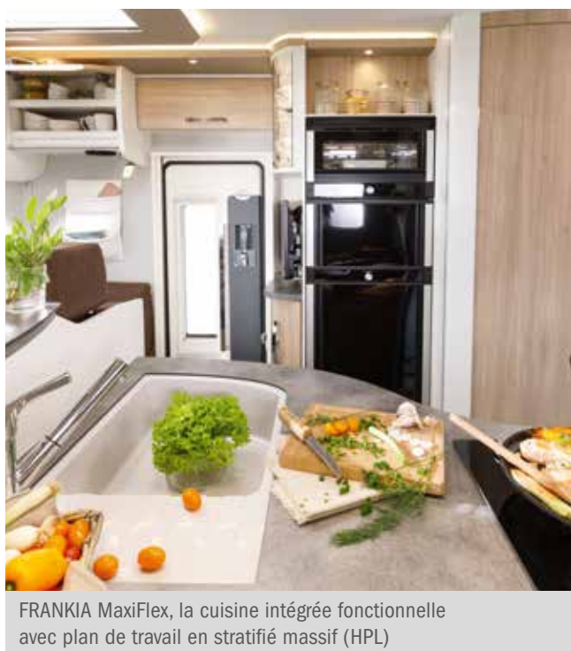
FRANKIA MaxiFlex, la cuisine intégrée fonctionnelle avec plan de travail en stratifié massif (HPL)