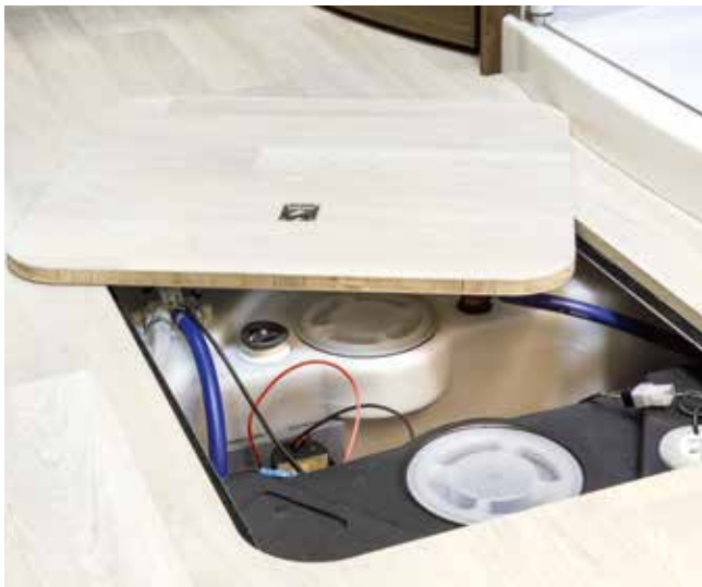
Double-plancher FRANKIA entièrement chauffé.