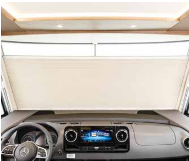
Store pare-brise occultant électrique