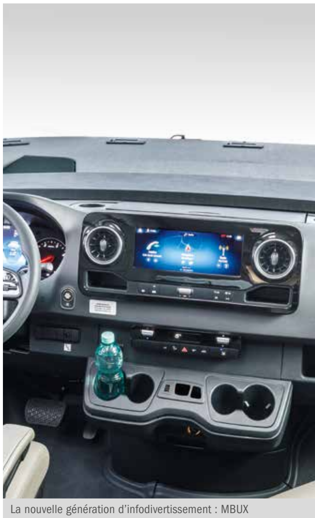
La nouvelle génération d'infodivertissement : MBUX