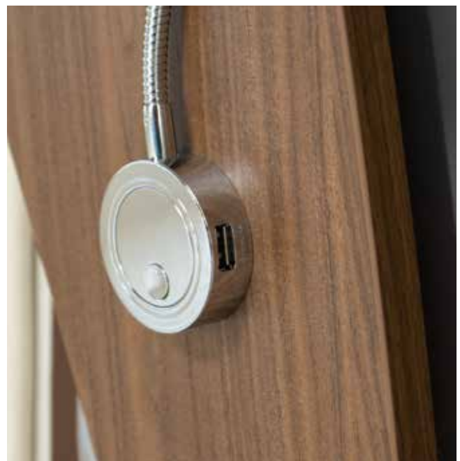
4 prises USB bien pratiques