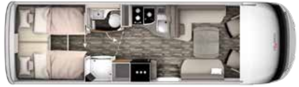
I 840 GD TITAN