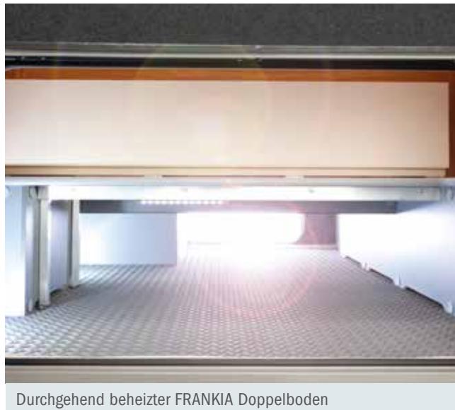
Durchgehend beheizter FRANKIA Doppelboden