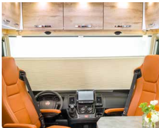
Elektrisches Front-Verdunkelungsplissee mit Privacy- und Sonnenblendenfunktion