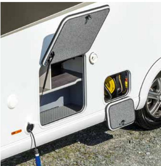
Selbstaurollende Kabeltrommel mit 15 m Kabel und Zentralversorgung