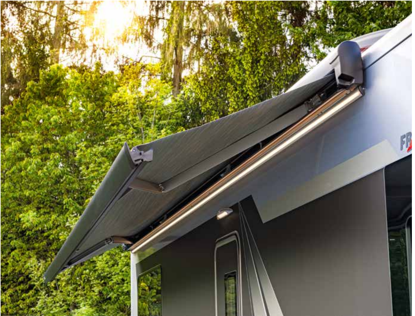
Markise - optional mit integriertem LED-Beleuchtungsprofil