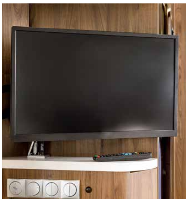
Flachbildschirm 24 Zoll