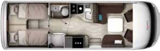
I 790 GD TITAN