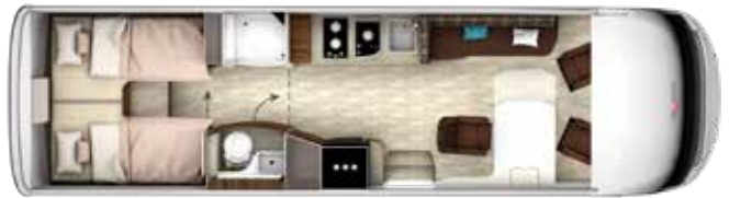
I 890 GD-B TITAN