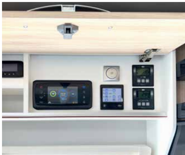
Zentrale Steuerung, gut sichtbar und einfach zu bedienen

2x Solaranlage 115 W mit Solarfernanzeige; TITAN NEXT: 3x Solaranlage 115 W mit Solarfernanzeige