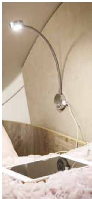
Mehrere praktische USB-Steckdosen