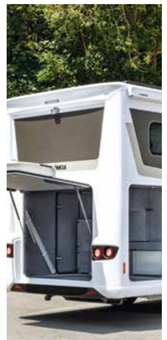
Verstellbare Heck- und Seitenklappen