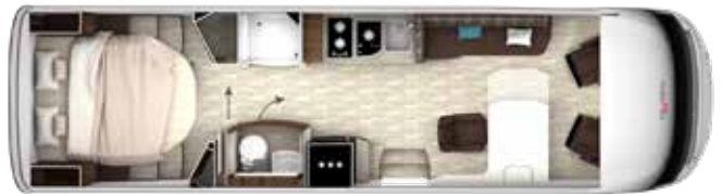
I 890 QD-B TITAN