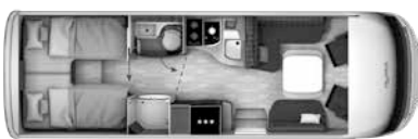
I 790 GD

Ducato 40 H, 180 PS, AL-KO Tieffrahmen, Euro VI, 5,5 t € 148.000,-