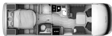
I 790 QD

Ducato 40 H, 180 PS, AL-KO Tieffrahmen, Euro VI, 5,5 t € 148.000,-