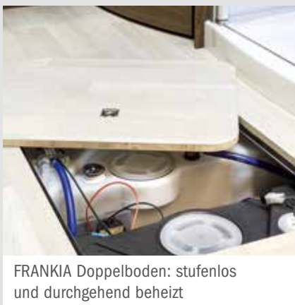
FRANKIA Doppelboden: stufenlos und durchgehend beheizt