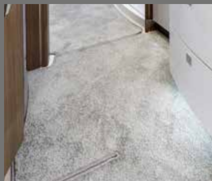
Pflegeleichter Teppichboden im gesamten Innenraum