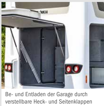
Be- und Entladen der Garage durch verstellbare Heck- und Seitenklappen