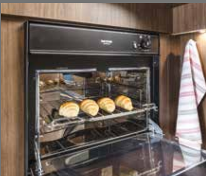
Integrierter Backofen von Thetford