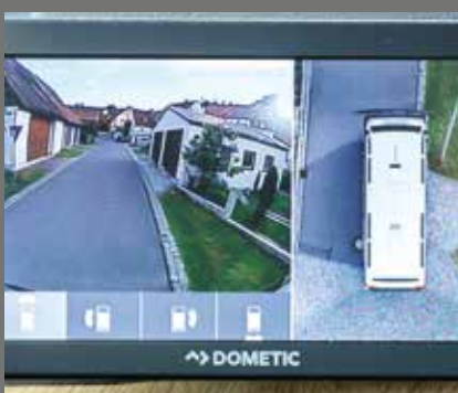
Alles im Blick: Bird-View-Cam mit 360°-Sicht und großem Display