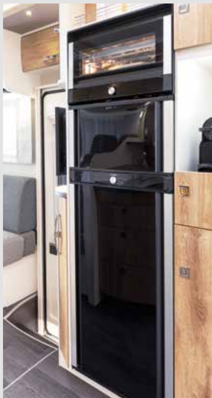
Kühlschrank und Gefrierfach im TecTower jetzt beidseitig zu öffnen (grundrissabhängig)

Serienausstattung der FRANKIA M-Line (Auswahl)