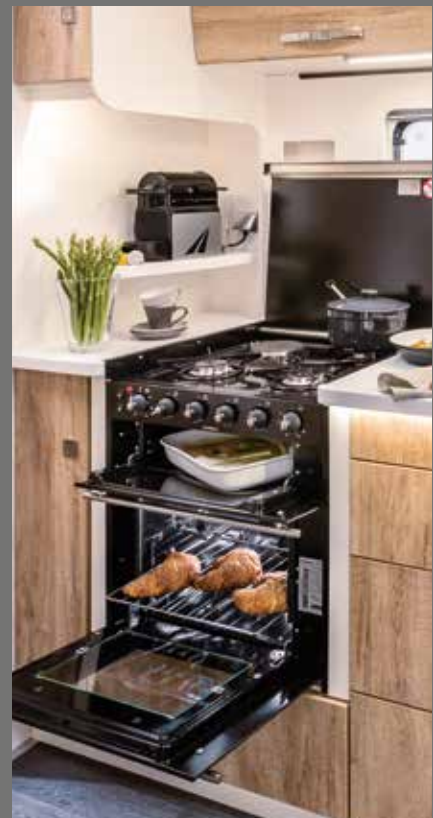
Küchensäule/Herdkombination (mit Grill, Gasbackofen, 3-Flamm-Kocher)