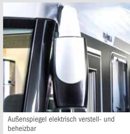
Außenspiegel elektrisch verstell- und beheizbar