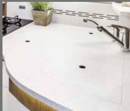
Pflegeleichte Küchenplatte – z. B. aus hochwertigem Mineralwerkstoff