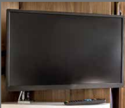
Flachbildschirm 24 Zoll