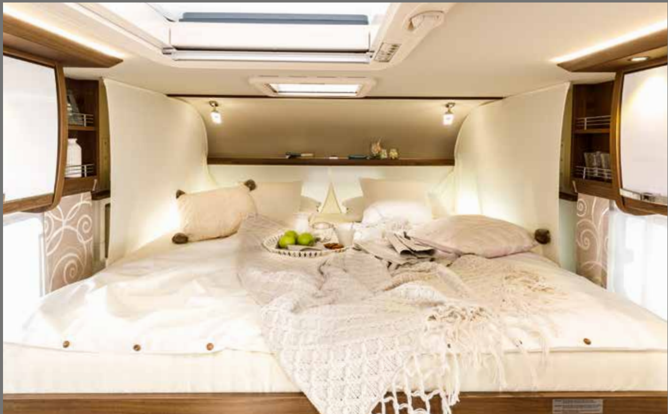
Ideal für Quer- und Längsschläfer: ausziehbares FRANKIA Duo-Bett (2 x 2 m)

Sonderausstattung der FRANKIA M-Line (Auswahl)